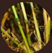
Ризоктониоз зерновых ( Rhizoctonia cerealis , R. solani )

Качество зерна падает за счёт снижения массы тысячи семян и наличия в них микотоксинов. Недобор урожая может составлять от 10 до 40%.