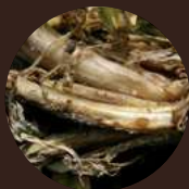
Тифулёз ( Typhula incarnata )

Поражённые посевы легают на уровне первого или второго междоузлия. Недобор урожая может составлять от 5 до 30%.