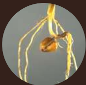
Фузариозная корневая гниль ( Fusarium spp.)

Почвенные патогены, семенные инфекции и подземные насекомые-вредители — основные угрозы для состояния корней. Минимальная обработка почвы, орошение, короткие севообороты, выращивание монокультур провоцируют распространение болезней.