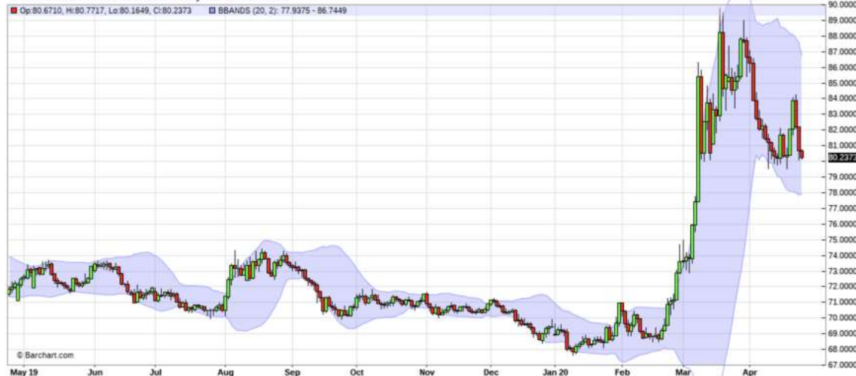
^EURRUB - Euro Fx/Russian Ruble - Daily Candlestick Chart