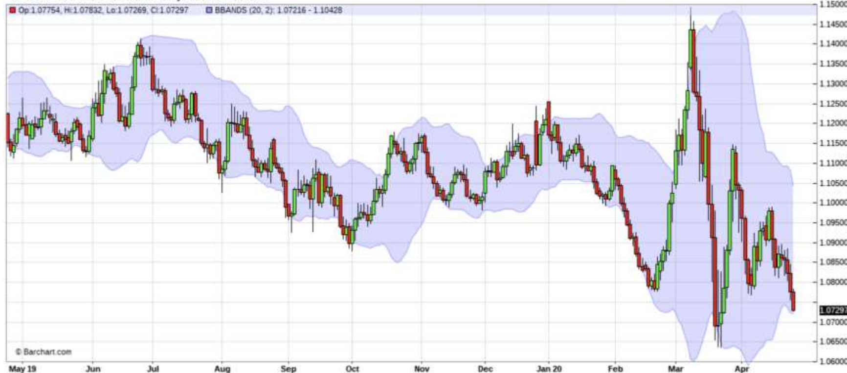
^EURUSD - Euro Fx/U.S. Dollar - Daily Candlestick Chart