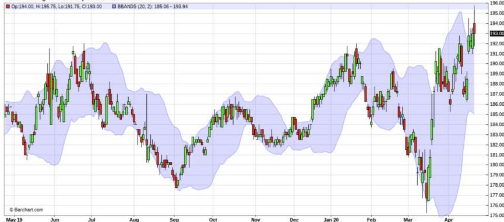
MLZ20 - Milling Wheat - Daily Candlestick Chart