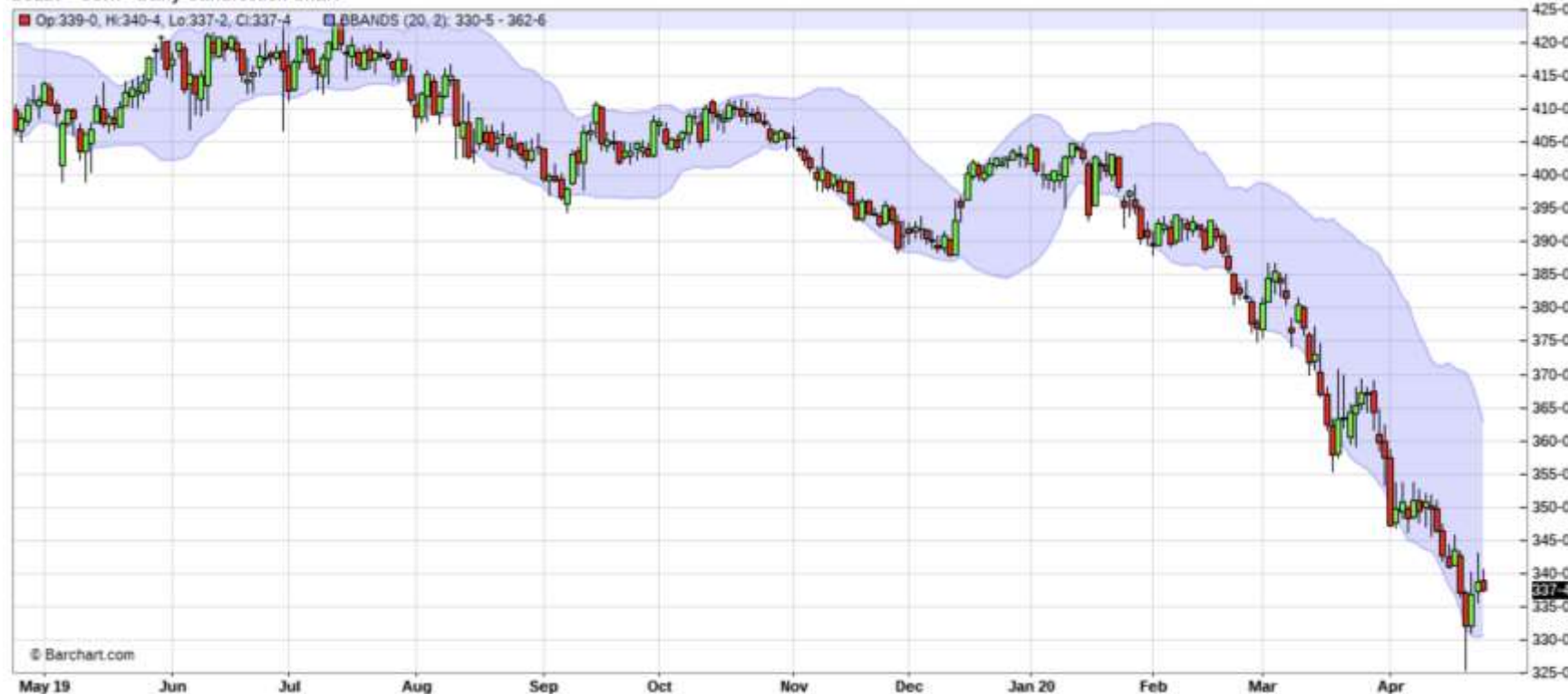
ZCZ20 - Corn - Daily Candlestick Chart