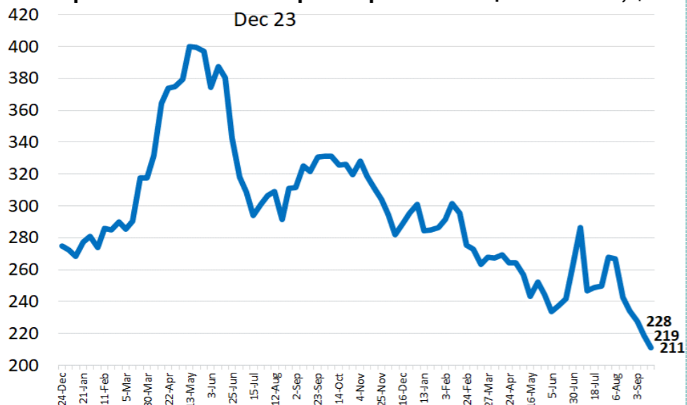
Экспортные цены FOB на пшеницу и кукурузу, USD/т