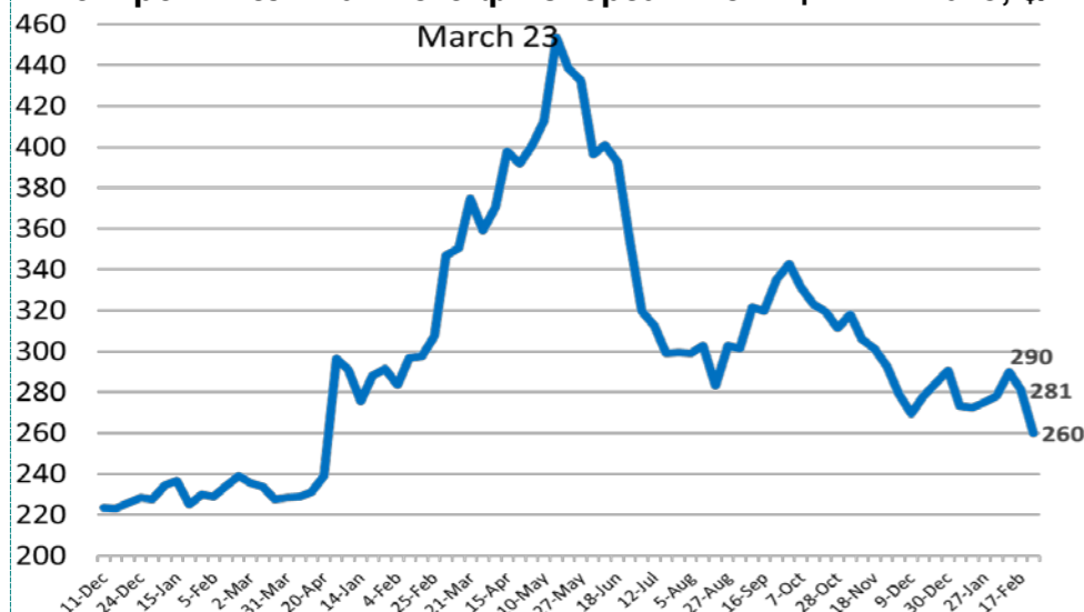
Экспортные цены FOB на пшеницу и кукурузу, USD/т