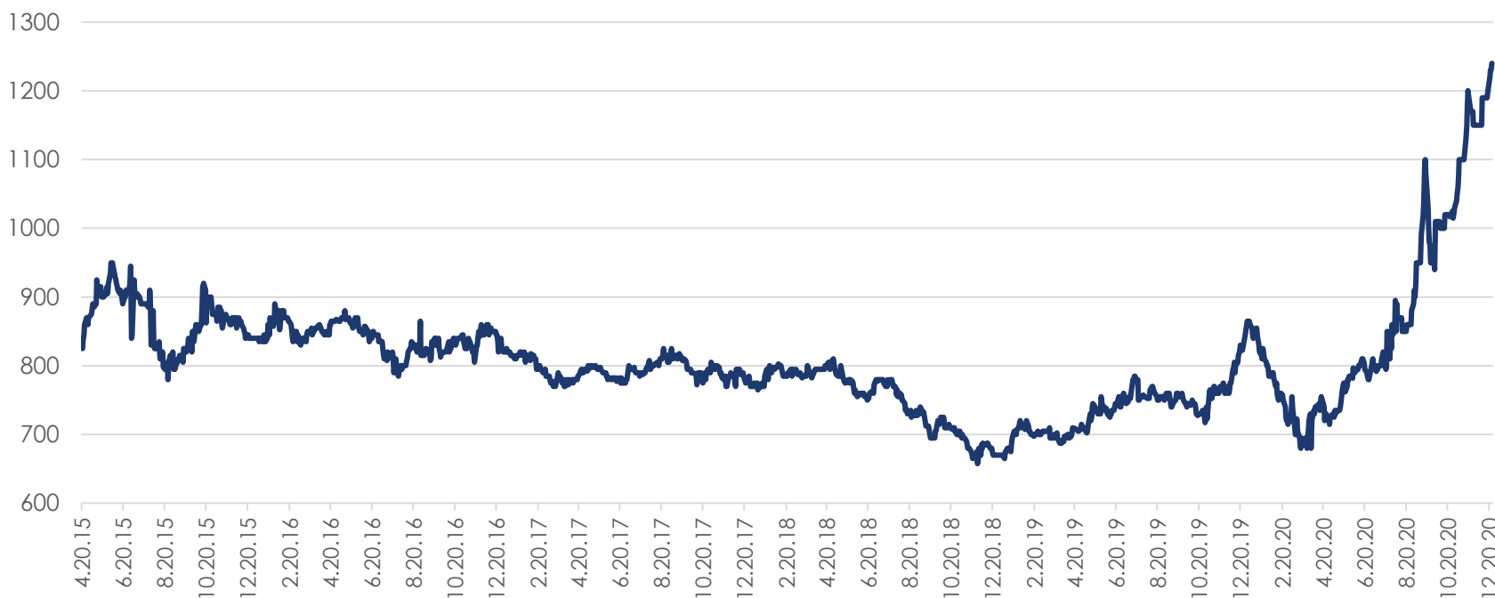
Цены на подсолнечное масло в Роттердаме FOB, $/т