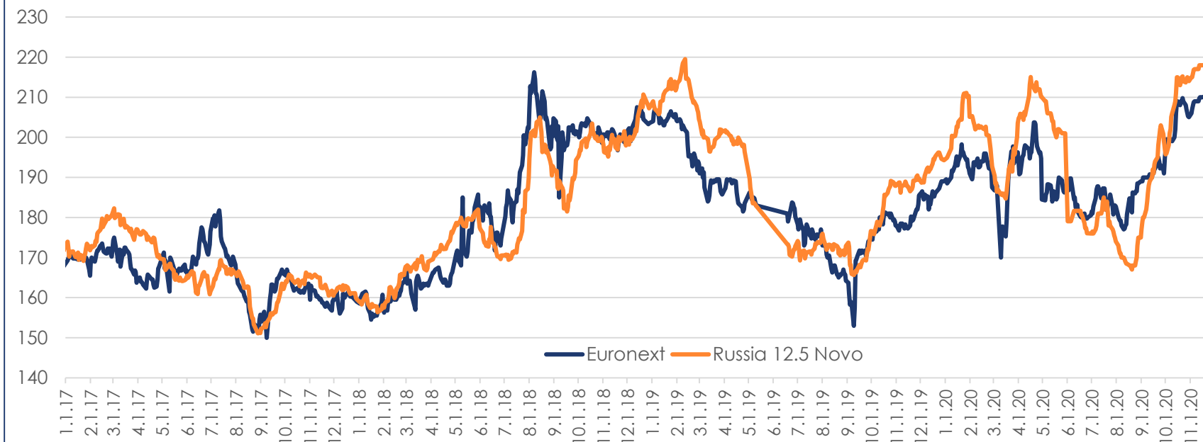
Цены на пшеницу FOB, евро/т