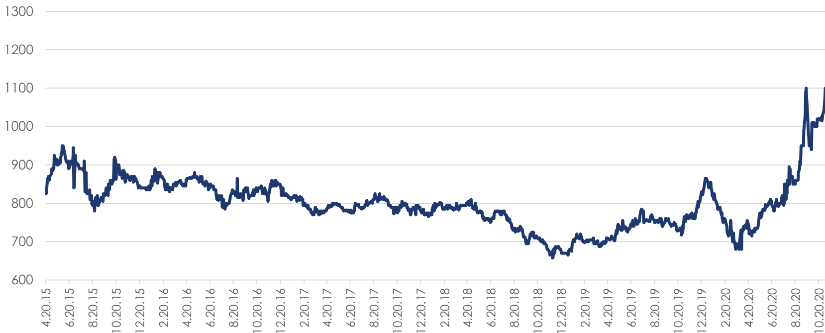
Цены на подсолнечное масло в Роттердаме FOB, $/т