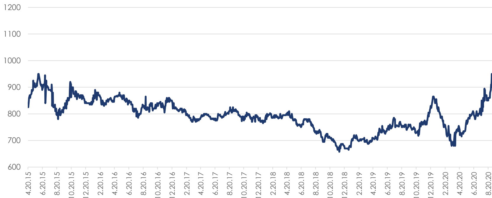
Цены на подсолнечное масло в Роттердаме FOB, $/т