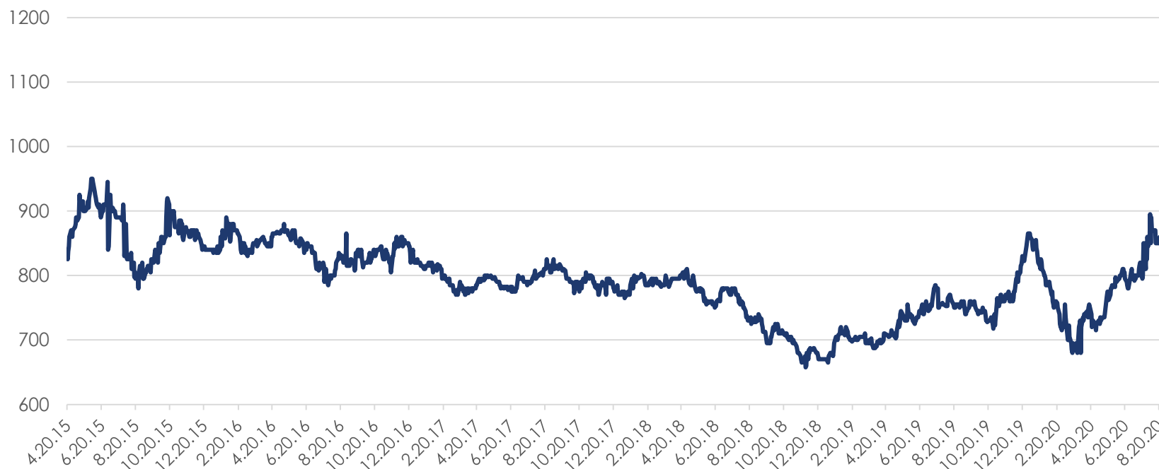
Цены на подсолнечное масло в Роттердаме FOB, $/т