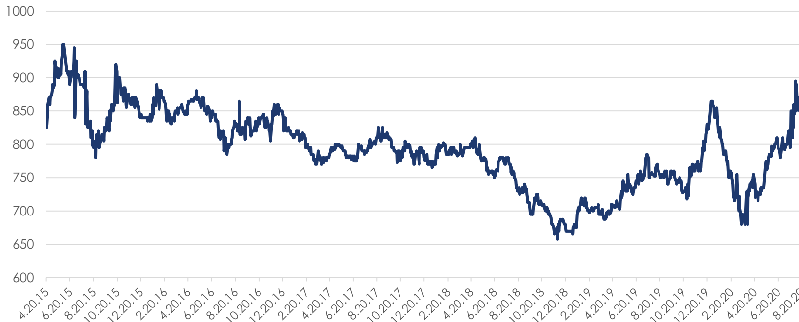
Цены на подсолнечное масло в Роттердаме FOB, $/т