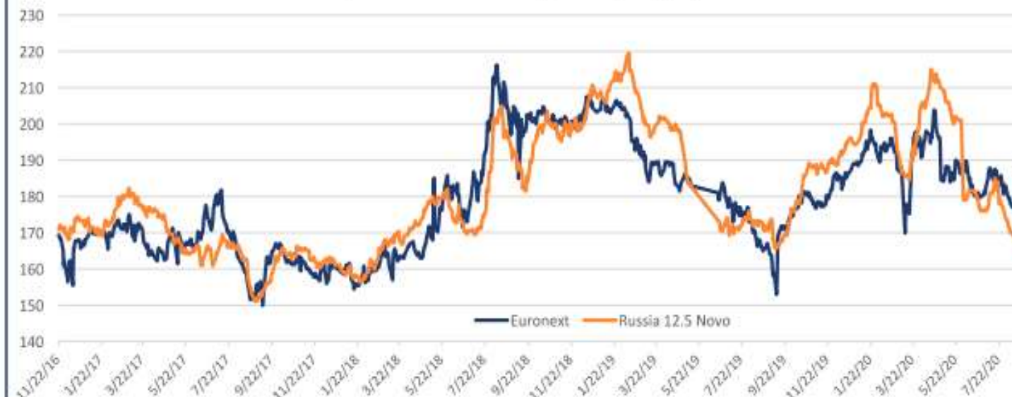
Цены на пшеницу FOB, евро/т