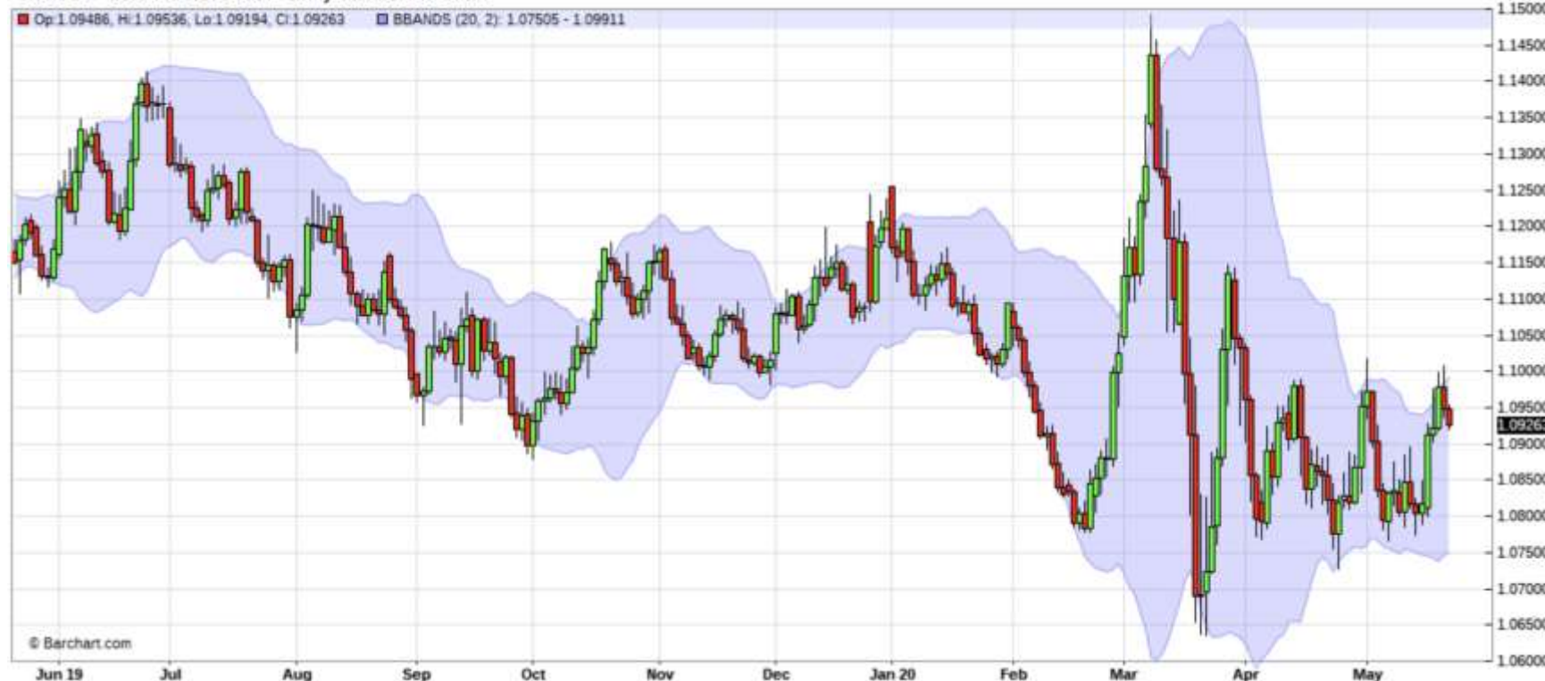
^EURUSD - Euro Fx/U.S. Dollar - Daily Candlestick Chart