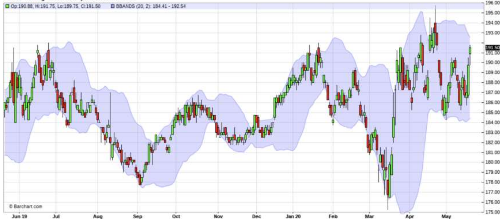
MLZ20 - Milling Wheat - Daily Candlestick Chart