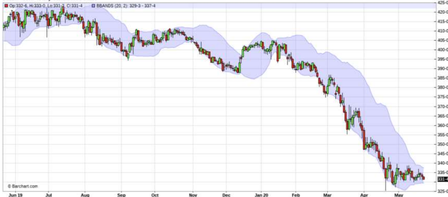
ZCZ20 - Corn - Daily Candlestick Chart