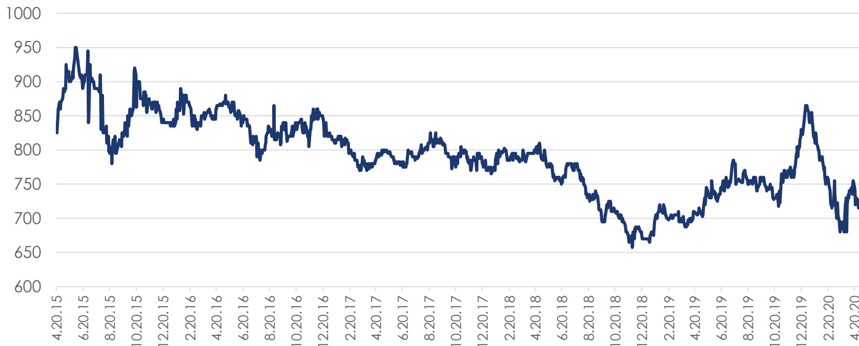
Цены на подсолнечное масло в Роттердаме FOB, в $/т