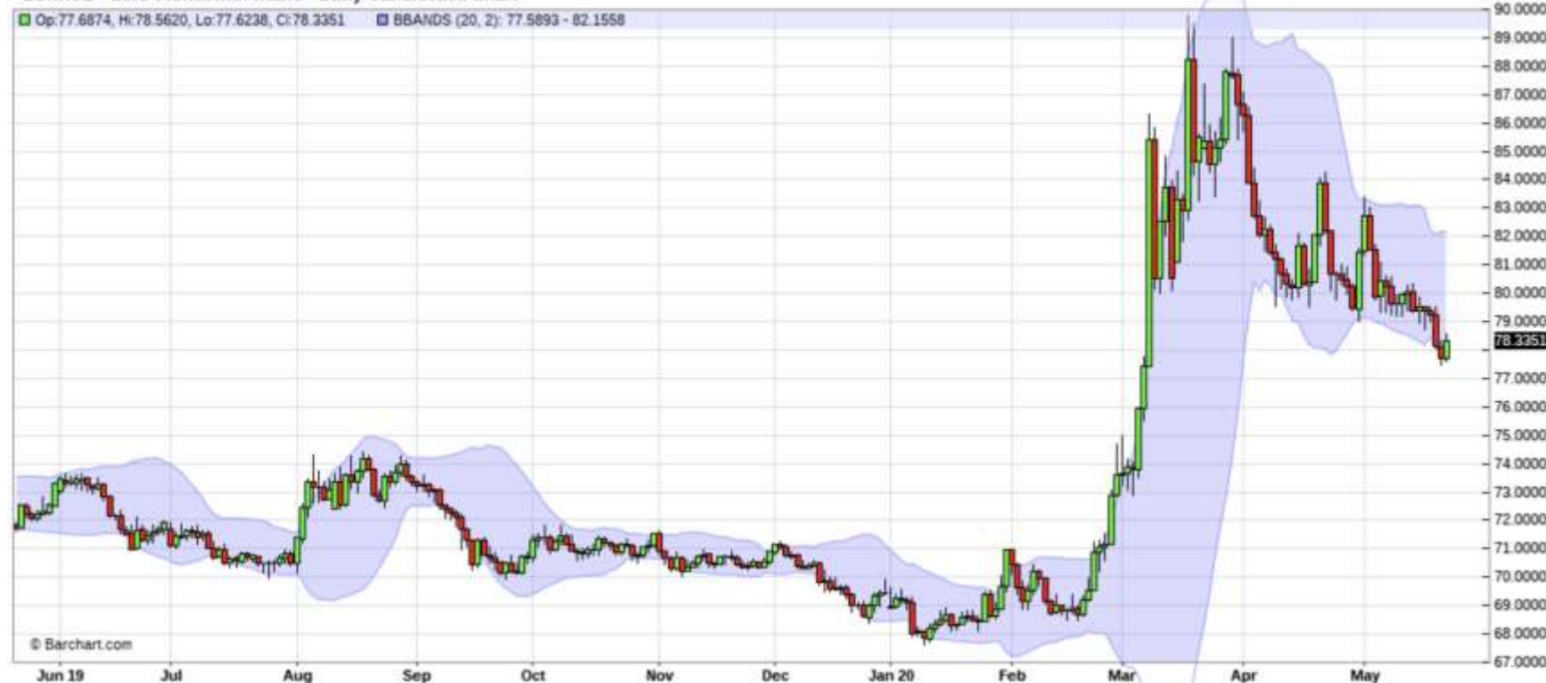
^EURRUB - Euro Fx/Russian Ruble - Daily Candlestick Chart